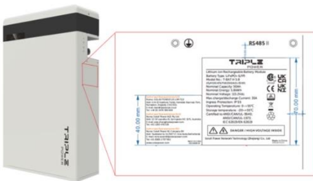
Označení Master baterie T58 V1

Další kombinace jako master baterie V2 (zřetelně označena na štítku) se slave bateriemi V1 je možná bez dalšího omezení.