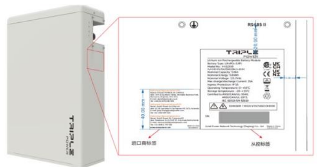
Označení Slave baterie T58 V1