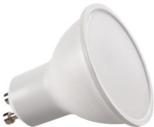
TOMiv2 1,2W GU10-NW