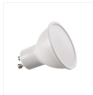
TOMiv2 6,5W GU10-NW