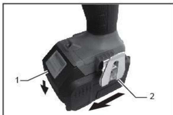
1. Tlačítko 2. Baterie