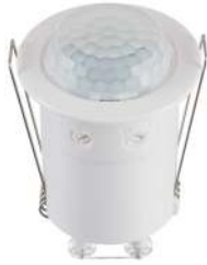
TG MD360 MINI DE WH