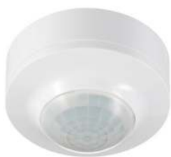
TG MD360 AP WH