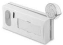
Obr 3. Polarita baterie