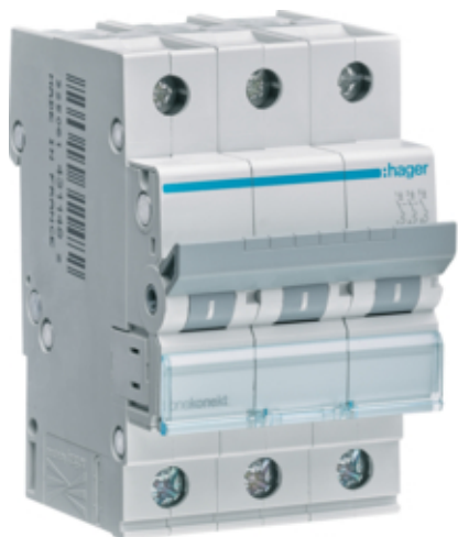
Jistič 3 pól. 16A, char.C, 6 kA