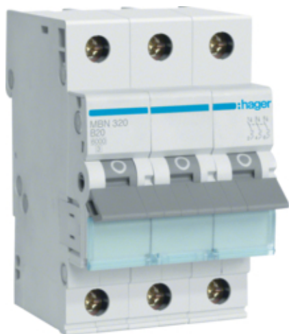
Jistič 3 pól. 20A, char.B, 6 kA