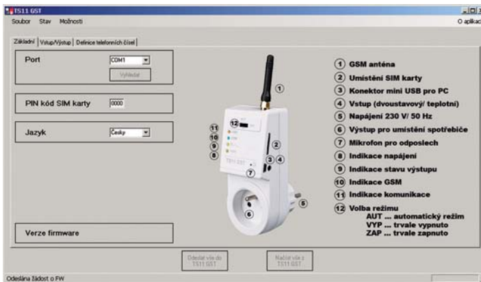
Úvodní obrazovka softwaru na PC