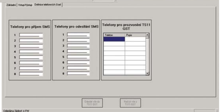
Záložka pro definici telefonních čísel