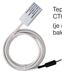
Teplotní čidlo CT06-10k-jack (je součástí balení).