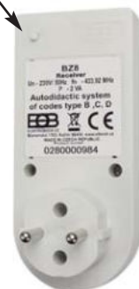
Obr.1 Funkční tlačítko (na zadní straně přijímače)

BZ8-NP je možné použít s vysílači NT-BCD a WS113 (montáž pod vypínač).