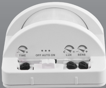
Přepínač funkcí a nastavovací trimry, které jsou schované pod krytkou